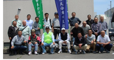
パレード支援支部会員

6月11日(土)創立61周年記念に伴う市中パレードが本町1丁目通りで行われた。滝川春の例大祭で例年使用していたすずらん通りが使用できず場所を変更しての開催。支隊長以下21名が交通誘導員として、パレードを支援した。 早朝7時集合、8時には配置完了。会員はお揃いのジャンパーと帽子を着用し、交通規制に伴う車両および人員を安全・的確に誘導し、パレード推進の一翼を担った。