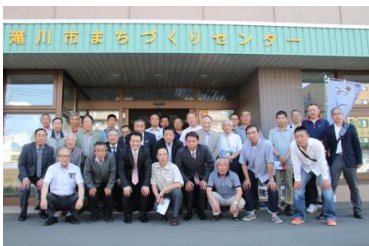
出席者と記念撮影