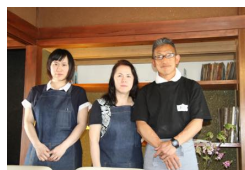
家族三人でおもてなし