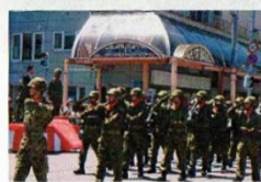
駐屯地開庁記念 行事支援 (札幌地方隊友会)